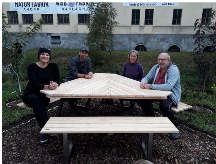
Sitzgelegenheit beim Spar-Parkplatz

Der Verein „L(i)ebenswertes Helfenberg“ konnte bereits einige Projekte umsetzen. Hier gibt es einen kleinen Auszug in Form einer Bildergalerie.